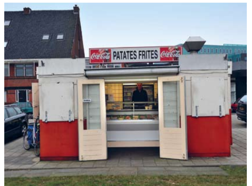
Raad de drie plekken en win een historische foto van Amsterdam Noord