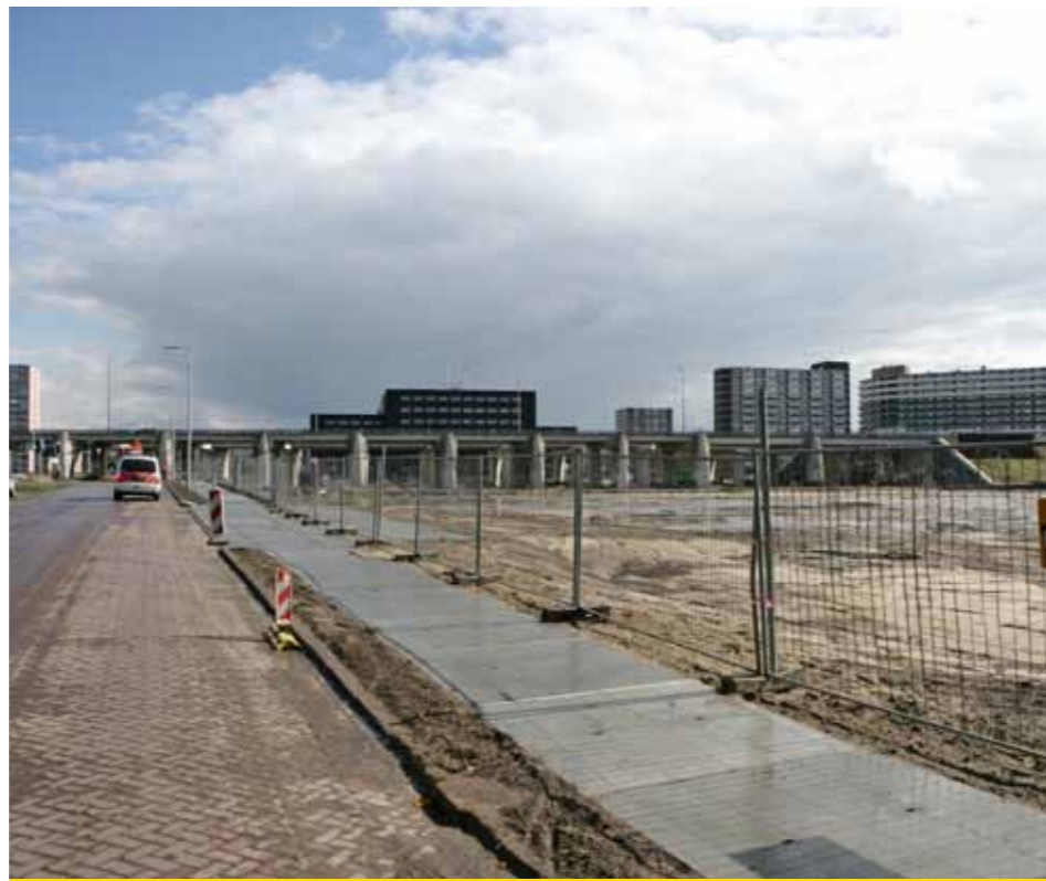
Veilige fietsroute Terwogtweg.

Naast het bouwterrein is parallel aan de Hans Meerum Terwogtweg een