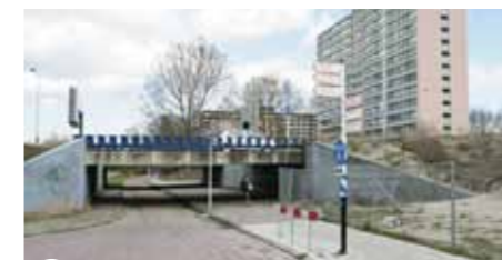
1 Verlegging IJdoornlaan