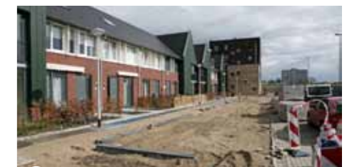
3 Elzenhagen Noord