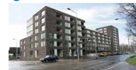
5 Het Schouw