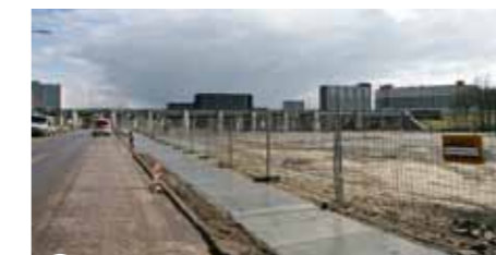
2 Tijdelijke busbaan & verlaging Waddenweg