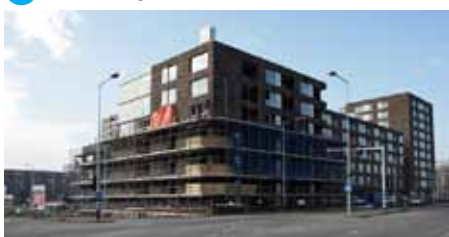
4 't Schouw