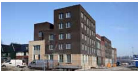
1 Elzenhagen Noord