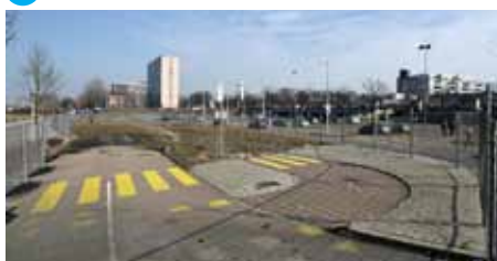
5 Tijdelijke busbaan/Waddenweg