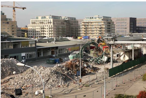
Sloop oude gebouwen Shell

Begin 2010 start de sloop van alle overige gebouwen, waaronder het Nieuw Lab en de gebouwen tegenover de Ranonkelkade. De sloop vindt plaats in opdracht van de gemeente. Voor de afvoer van het sloopmateriaal wordt gebruik gemaakt van een route over de Ridder-spoorweg zodat overlast in de Van der Pekbuurt zoveel mogelijk wordt beperkt. Meer informatie: www.overhoeks.nl