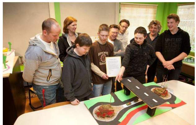
Leerlingen Clusius College met ontwerp Botonde

Meer informatie: centrumamsterdamnoord.nl