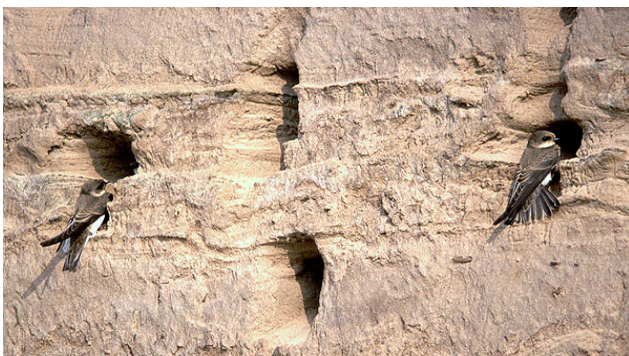
Oeverwaluwwand Elzenhagen Zuid

De oeverwaluwwand die in maart 2009 is gemaakt is een groot succes. Meer dan 100 broedparen gebruiken deze tijdelijke wand. De wand ligt bij het talud naast het tijdelijke ROC in Elzenhagen Zuid en is bijna 75 meter lang. Ook het komend broedseizoen blijft de oeverwaluwwand liggen.