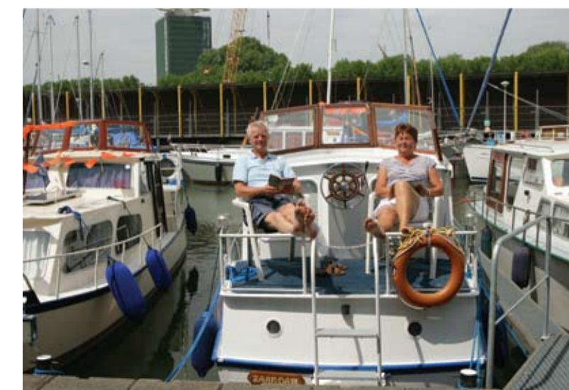
Lekker loom dobberen in de zonnige Sixhaven.