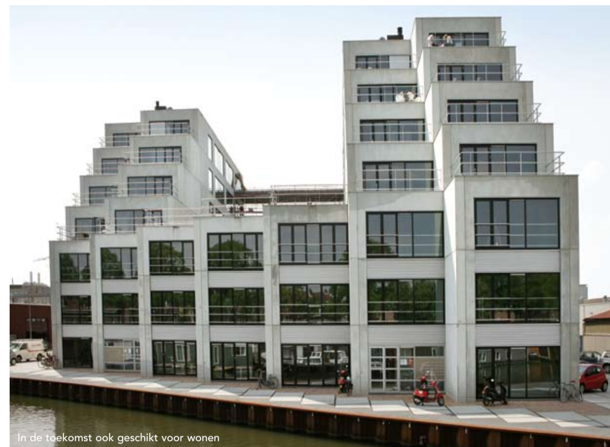
In de toekomst ook geschikt voor wonen

pakhuis, dus de eigenaar kon het verder inrichten zoals hij wilde. De wat kleinere units heeft hij samengevoegd tot grote ruimtes. En op de vierde en vijfde verdieping wilde hij de twee torens meer bij elkaar trekken door de lichtbrug te overdekken. Een overdekte lichtbrug zat eigenlijk ook in het eerste ontwerpplan, maar de toenmalige eigenaar vond het niet nodig. Nu is die overkapping er dus toch gekomen.'