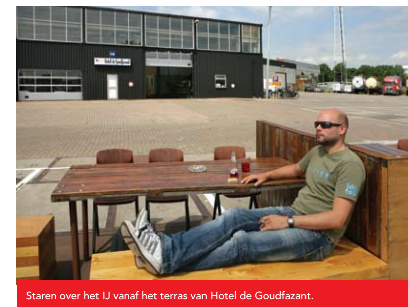
Staren over het IJ vanaf het terras van Hotel de Goudfazant.