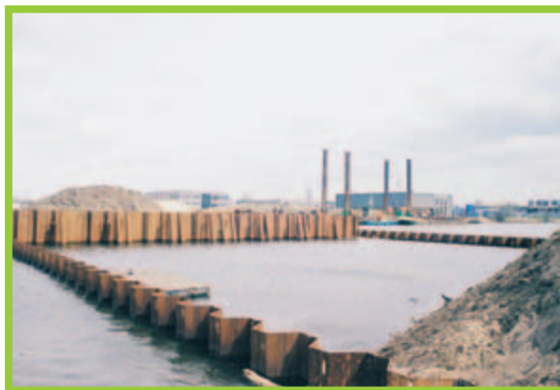
Ridderspoorweg in aanleg

De effecten zijn merkbaar in de Buiksloterham. Er is een toenemende vraag naar verschillende typen bedrijfsruimte. Het trekt ondernemers aan die graag in