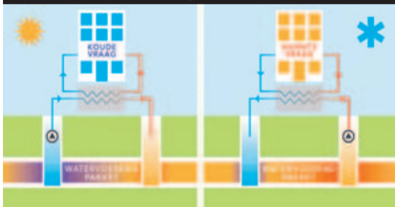
Schematische weergave warmte-koude-opslag (WKO)

'Je moet je voorstellen dat diep in de grond een waterhoudende zandlaag zit. Het water zit ingesloten en kan nergens heen', zegt Wim Vogel van Shell. 'Dat water heeft een vrij lage temperatuur. In de zomer wordt in de gebouwen boven de grond warm water geproduceerd door het koelsysteem. Dit warme water leid je ondergronds, waar de warmte wordt afgegeven aan de koudere waterlaag. Zo laat je warmte achter. Het koelere water wordt weer omhoog gepompt om de gebouwen te koelen. De warmte blijft in het water beneden zitten omdat het niet weg kan. 's Winters werkt het andersom. Koud water leiden we naar beneden waar het warmte ophaalt uit de warmere waterlaag en mee naar boven vervoert. Met dit warmere water worden de gebouwen verwarmd. Eigenlijk is het dus een grote boiler. Een fraai en ingenieus systeem. En door dit systeem te gebruiken, zal ons aardgasverbruik bijna tot 0 worden teruggebracht. Dit is een besparing van zo'n 190.000 gJoule aan gas per jaar. Dat was ook de opzet. We kiezen voor duurzaamheid.' Op het Shellterrein worden twee systemen geïnstalleerd door GTI