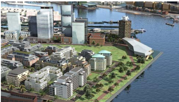
Impressie van Overhoeks met de hoogbouwstrip

U kunt de welstandscriteria downloaden via: www.noordwaarts.nl onder kopje 'Overhoeks'.