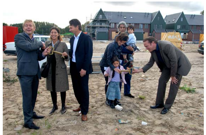
De eerste bewoners van Elzenhof nemen de sleutel in ontvangst

de eerste bewoners van het bouwblok Elzenhof. Elzenhof ligt in de buurt Elzenhagen-Noord, waar de komende weken 45 woningen worden opgeleverd. Dit zijn de eerste woningen in het CAN gebied waar in totaal 3.300 woningen komen. De woningen in Elzenhof zijn kleurrijk, in Zaanse- en Tuindorpstijl gebouwd en geschikt voor jonge gezinnen, gezien de kindvriendelijke omgeving. De woningen zijn van ontwikkelaar Stadgenoot/Kristal.