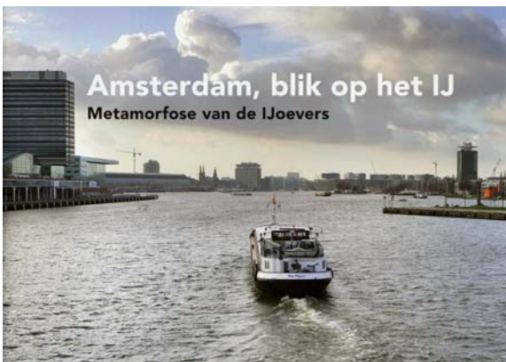
brochure 'Amsterdam, blik op het IJ' ©2008

Bestellen via: info@noordwaarts.nl onder vermelding van: "Amsterdam, blik op het IJ". Meer informatie; projectbureau Noordwaarts, tel. 020-630 6300.