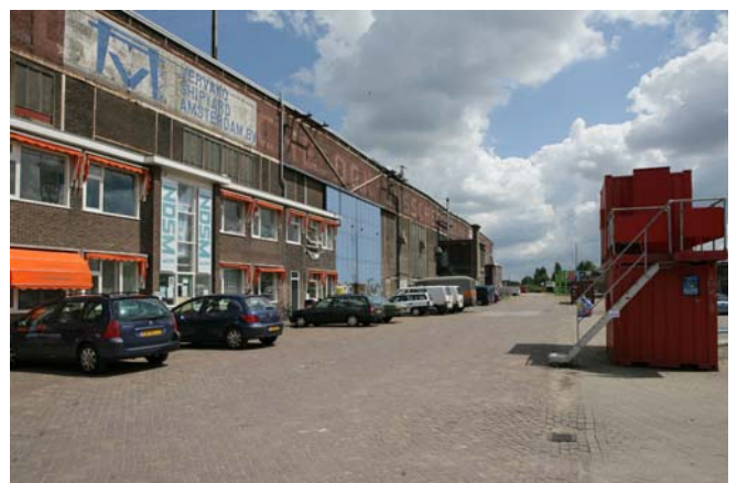
Scheepsbouwloods op het NDSM-terrein

De commissie Leefomgeving van het stadsdeel neemt medio november een standpunt in over de verkoop. Indien het dagelijks bestuur vervolgens positief besluit kan voor het eind van het jaar de overname zijn afgerond.