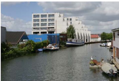
Buiksloterham, links gebouw Boomerang casa

De BSH is nu een industrieterrein dat voorzien is van een geluidzone. Dit betekent dat er bedrijven gevestigd mogen zijn, die veel geluid produceren. Om het mogelijk te maken dat er naast bedrijvigheid ook woningen in de BSH worden gebouwd, moet de milieuhinder, met name de geluidshinder worden beperkt. Pas dan kan er in het bestemmingsplan ook de bestemming wonen worden opgenomen. Het bestemmingsplan wordt in de eerste helft van 2009 door de gemeenteraad vastgesteld. U kunt het bestemmingsplan downloaden via www.noordwaarts.nl onder kopje 'Buiksloterham'.