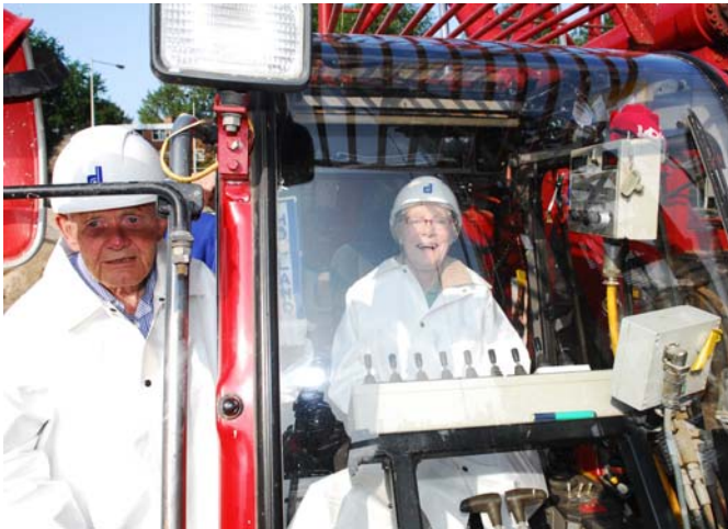
Bewoners heien de eerste paal voor Blok Omber