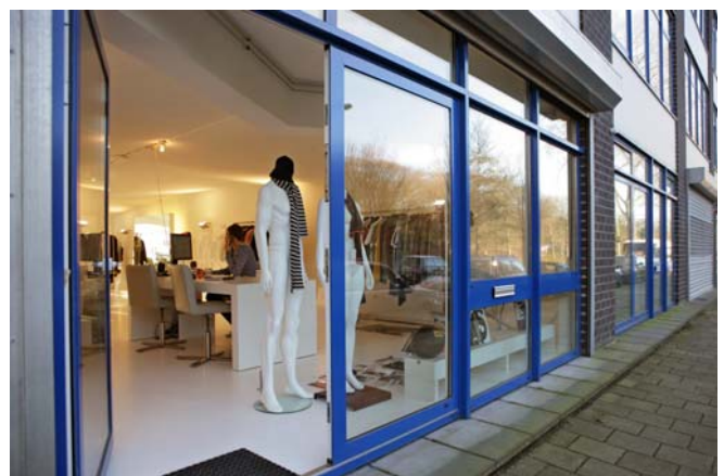
G-sus industries, gevestigd op de J. van Hasseltweg in het Hamerstraatgebied

Meer informatie: www.noordwaarts.nl , kopje Hamerstraatgebied.