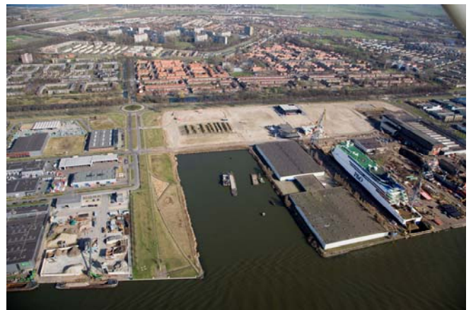
de insteekhaven op het Cornelis Douwesterrein

De verplaatsing van de baggervloot is om twee redenen noodzakelijk. Ten eerste maakt het woningbouw in de directe omgeving van de haven van Waternet mogelijk. Ten tweede kan door de verplaatsing de westelijke weg in de Buiksloterham worden aangelegd.