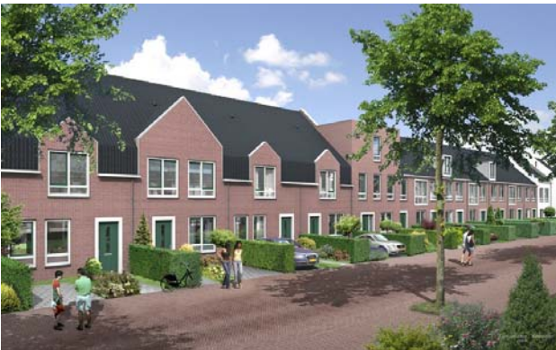
artist impression van woningen in Elzenhagen

Op 20 mei jl. heeft het Dagelijks Bestuur van het stadsdeel Amsterdam-Noord de 9 straatnamen voor de nieuwe woonwijk Elzenhagen-Noord vastgesteld.