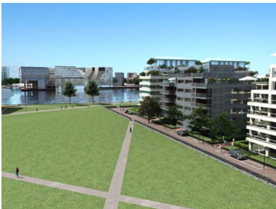
de groene scheg van Overhoeks

Het Programma van Eisen is op 24 juni jl. door het dagelijks bestuur van stadsdeel Amsterdam-Noord vastgesteld. Op basis van hiervan worden ontwerpen gemaakt voor de inrichting van de openbare ruimte.