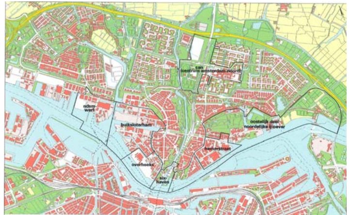
De werkgebieden van projectbureau Noordwaarts: NDSM-werf, Buiksloterham, Overhoeks, Sixhaven (incl. Tolhuistuin), CAN en Hamerstraatgebied