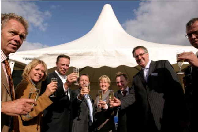
een toast op de start bouw van Overhoeks

Mogelijk komen tegen het einde van het jaar weer woningen in verkoop. Om op de hoogte te blijven van de ontwikkelingen in Overhoeks, kunt u zich aanmelden voor de digitale nieuwsbrief via: www.overhoeks.nl .