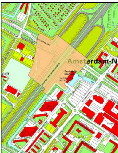
Globale begrenzing Stationsgebied in bestaande situatie

Het Bestuurlijk Overleg Noordwaarts heeft op 4 oktober jl. het investeringsbesluit voor het Stationsgebied CAN in grote lijnen goedgekeurd. In een investeringsbesluit wordt het globale plan uit het Projectbesluit uitgewerkt en kan na goedkeuring ook daadwerkelijk worden geïnvesteerd. Het Stationsgebied beslaat de directe omgeving rondom het nieuwe metrostation Buikslotermeerplein (Noord/Zuidlijn) en het nieuwe busstation. De verlegging van de IJdoornlaan maakt tevens onderdeel uit van het besluit. Het Stationsgebied is de plek waar in de toekomst veel mensen Amsterdam-Noord binnenkomen of verlaten. Op 12 november a.s is er om 19.30 uur een informatieavond in het stadsdeelhuis waarvoor omwonenden en belanghebbenden zijn uitgenodigd. Het projectteam van het CAN geeft een toelichting op de stedenbouwkundige uitwerking van het gebied. Het investeringsbesluit gaat vervolgens voor advies door naar de stadsdeelraad en daarna naar de Gemeenteraad.