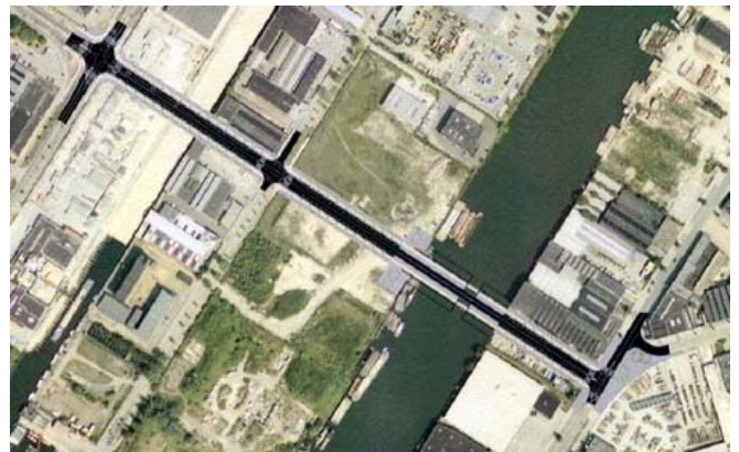
Toekomstige Ridderspoorweg met linksboven de Klaprozenweg en rechts onder de Asterweg/Distelweg.

De Ridderspoorweg loopt vanaf de Klaprozenweg, in het verlengde van de Floraweg, over het Johan van Hasseltkanaal naar de Asterweg. De aanleg van de Ridderspoorweg is een belangrijke verbetering voor de ontsluiting van de Buiksloterham. Na de aanleg van deze verbinding kan de gevaarlijke stoffenroute worden aangepast. Er rijdt dan geen vrachtverkeer meer door de woonwijk Disteldorp en ook de totale verkeersdruk in deze wijk zal afnemen.