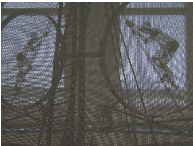
Detailuitsnede van kunstwerk

Vanaf maart 2007 tot eind 2008 ligt in het IJ bij Overhoeks een tijdelijk kunstwerk, als opmaat voor de ontwikkeling in dat gebied. Het kunstwerk is een gezamenlijk initiatief van het stadsdeel, Noordwaarts en ING/Ymere. Kunst en Bedrijf is ingeschakeld om de uitvoering te begeleiden en een kunstenaar te selecteren. Op basis van hun voorselectie is vorig jaar voor de Duitse kunstenaar Thomas Bartels gekozen. Bartels ontwierp een boei, die aan de voet een doorsnede van 15 meter heeft en 15 meter hoog is. In de boei is een soort animatie zichtbaar van klimmende figuren. Doordat de boei in het donker verlicht is, zijn deze figuren zowel overdag als 's nachts zichtbaar. De boei straalt de sfeer van het gebied uit: industrie, beweging, hard werken en naar de toekomst gericht.