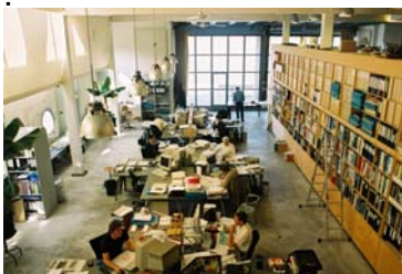
Moderne bedrijvigheid in de Buiksloterham

Het Investeringsbesluit gaat na een ambtelijk adviesronde voor vaststelling naar het Bestuurlijk Overleg Noordwaarts. Vervolgens komt behandeling in de Stadsdeelraad en daarna naar de Gemeenteraad. Na vaststelling is er geld voor de daadwerkelijke uitvoering van de plannen.