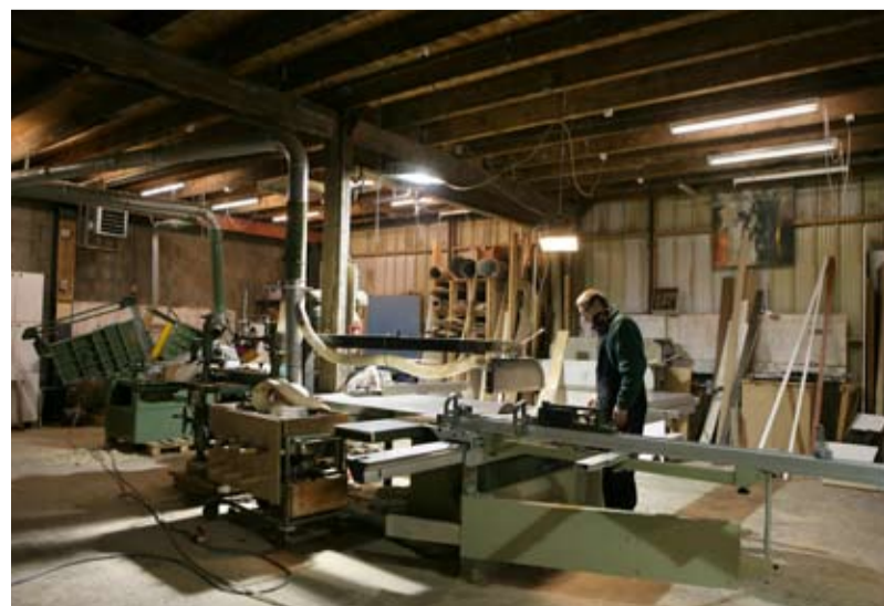
Meubelmakersstudio EWE, Zamenhofstraat 118, 1022 AG Amsterdam